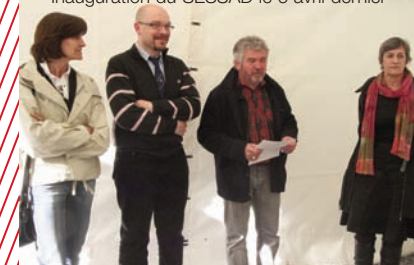
Inauguration du SESSAD le 6 avril dernier

Un SESSAD coordonne l'action des professionnels pour mettre en œuvre des projets individualisés.