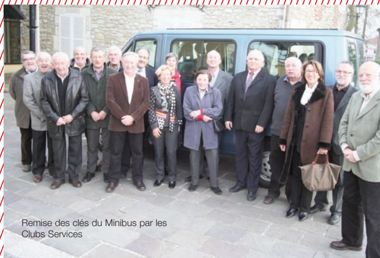
Remise des clés du Minibus par les Clubs Services

Tisser du lien entre les générations, faire en sorte que personne ne demeure dans l'isolement en raison