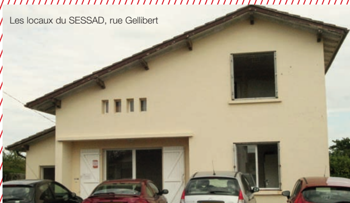
Les locaux du SESSAD, rue Gellibert

autant d'objectifs que la Ville souhaite atteindre.