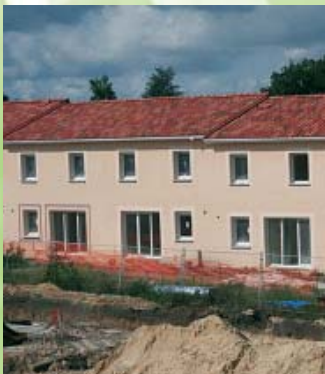
« Une volonté de créer des logements en centre-ville, en donnant une orientation sociale ».

Situés dans le périmètre de la ZAC du Centre, à l'arrière du nouvel espace commercial, ces logements comprennent 28 maisons jumelées (T4 et T5) et 12 appartements (T2, T3 et T4). Ce projet privé a été confié à la CIRMAD (promoteur immobilier), pour le compte de la Foncière Logement. Cette association Loi 1901 a notamment pour objectif de développer une offre locative destinée en priorité aux salariés des entreprises du secteur privé assujetties au 1% logement.