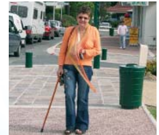
« Il y a encore beaucoup à faire, à tous les niveaux, pour améliorer la vie du handicapé ou de ceux qui ont une mobilité plus réduite, comme les personnes âgées. L'exemple a été donné et c'est très bien ».

Un nouveau cadre de vie qui profite à tous, spécialement aux personnes handicapées ou à mobilité réduite. Témoignage d'une dame de volonté et de bonté.