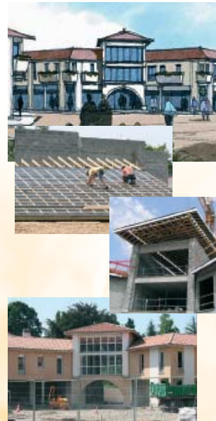
Les différentes étapes des travaux, depuis les premiers coups de pioche en septembre 2005. Vous aurez le plaisir de commencer à profiter de ce nouvel espace à partir de la fin de l'année.

11 commerces et services : banque, bar-brasserie avec terrasse, laboratoire d'analyses médicales, laverie automatique, librairie-presses, opticien, pharmacie, salon d'esthétique, salon de coiffure, supérette alimentaire, sans oublier les cabinets de rhumatologie, dentisterie et kinésithérapie ainsi que la Trésorerie de Saint-Paul-lès-Dax.