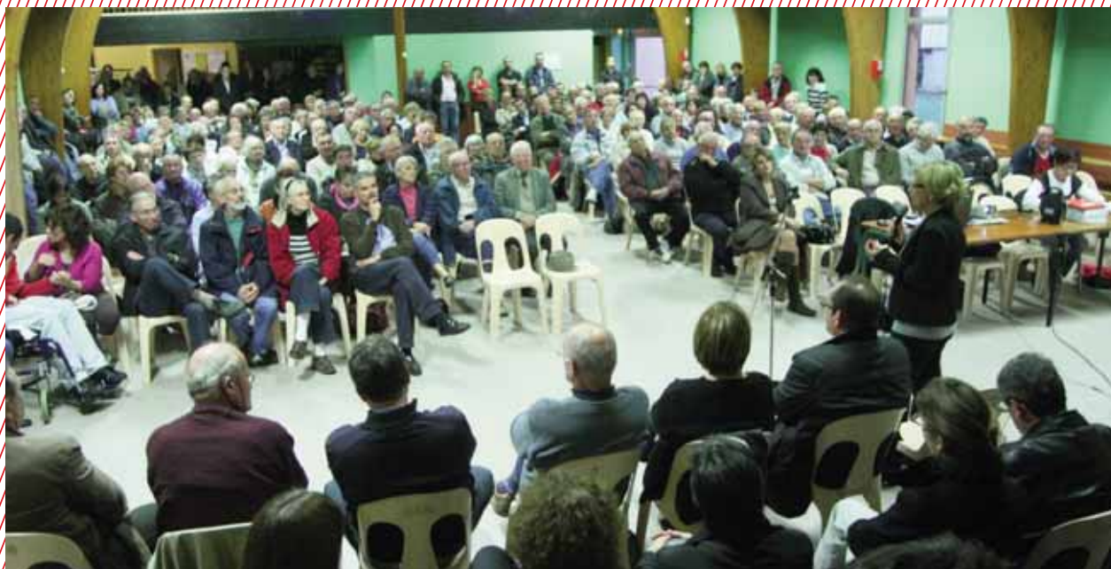
Les réunions de quartier : un moment fort de la démocratie participative. Ici, réunion de quartier à la salle du Temps Libre.