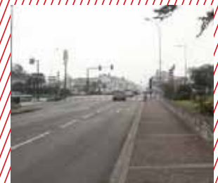
Zone 30 et aménagements des voies et des trottoirs