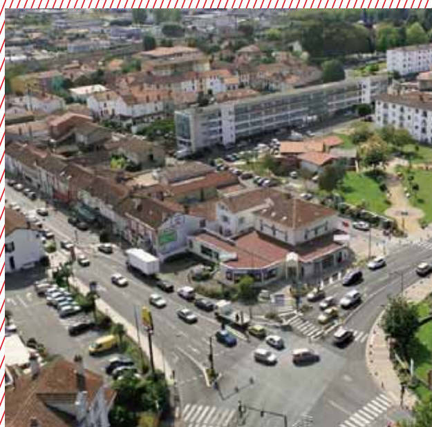
Circulation au centre ville