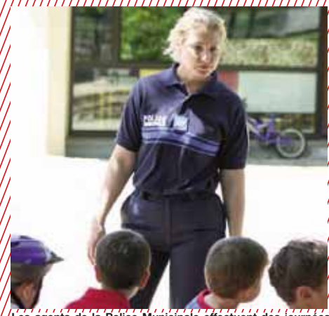
Les agents de la Police Municipale effectuent des journées de prévention routière dans les écoles.

Poste de Police Municipale Tél. 05 58 91 20 40