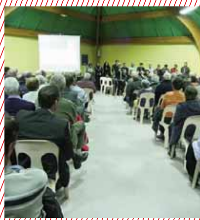
Vous avez été nombreux à assister aux réunions de quartier.