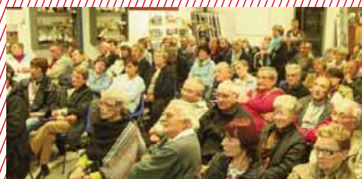
Réunion de quartier à Aurus

La Ville étudie actuellement la possibilité de réaliser une autre aire de stationnement pour les camping-cars.