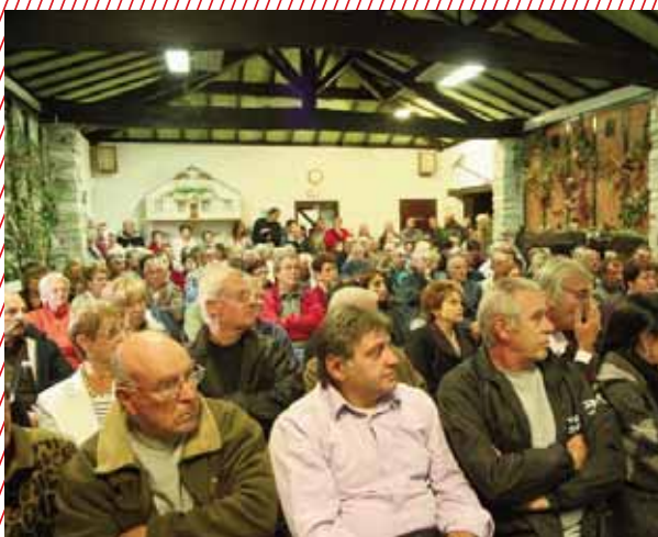
Réunion de quartier au Capot

Cela permet de promouvoir un partage équitable de l'espace urbain entre tous les usagers de la voirie, faire évoluer durablement les