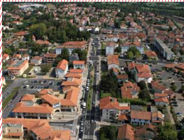
L'aménagement de l'Avenue de la Résistance

Actuellement, une étude est conjointement menée par les services municipaux, la Communauté d'Agglomération du Grand Dax et les services du Conseil général des Landes pour recenser les équipements existants et envisager la possibilité de créer plus de pistes cyclables. Néanmoins, le développement ou l'amélioration des bandes cyclables se fera dans la limite des possibilités techniques et budgétaires des collectivités concernées.